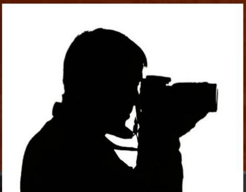
Photos du club