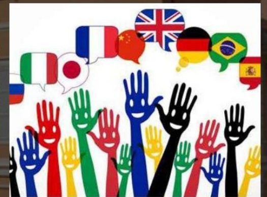
L'homme et la mer