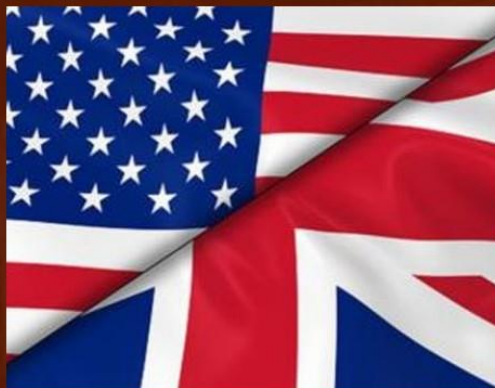
Les Britanniques et la mer