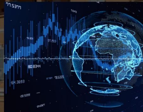
Sensibilisation, impact des défaillances des marchés