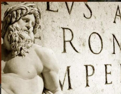
La mer et l'Antiquité