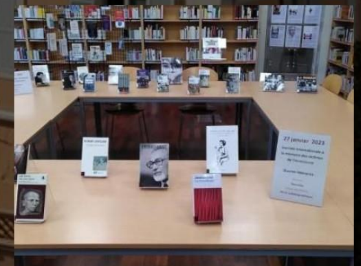
A la bibliothèque