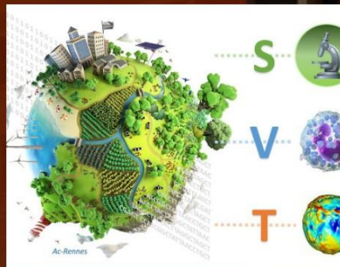
Biodiversité marine et impact de l'Homme