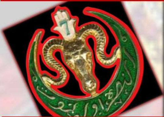
Blason du 7ème régiment des tirailleurs algériens dont il fait partie