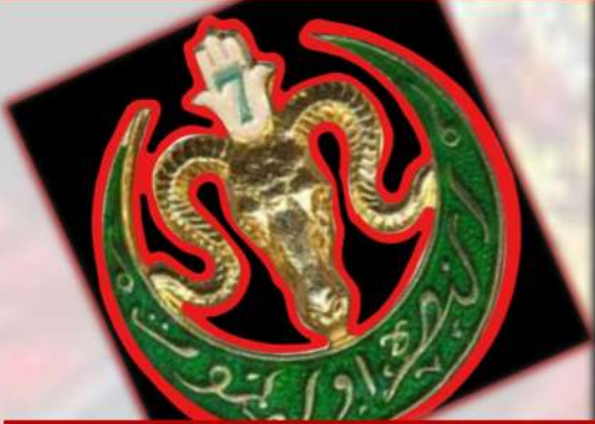
Coat of arms of the 7th regiment of Algerian riflemen of which he was a member