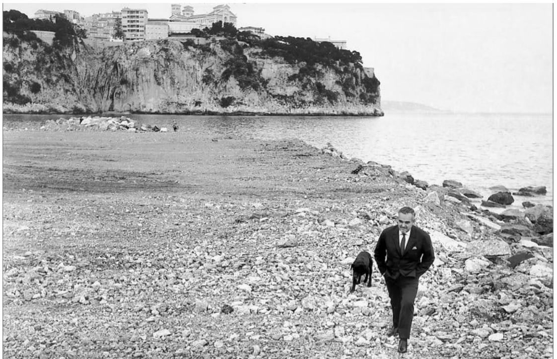
Rainier III marchant en bord de mer, Extension Fontvieille

Cela contribue à la protection des écosystèmes et de la biodiversité, de plus à la sensibilisation des acteurs du milieu marin et du grand public à des comportements vertueux, en outre à l'optimisation de la lutte contre les événements de pollution.